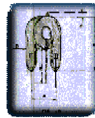
FIG. N.º 3

As lâmpadas por descarga de gás xenônio ou krypton são formadas por um tubo de vidro, geralmente na forma helicoidal, contendo em seu interior o gás sob pressão. Possuem dois eletrodos em suas extremidades, os quais trabalham com tensões elevadas, próximas de 500 volts. Um terceiro eletrodo, em volta do tubo, chamado de ionizador, opera com pulsos de até 6.000 volts, produzido por uma bobina, junto à própria lâmpada. Ao receber estes pulsos, o gás é ionizado, gerando um plasma, o qual emite uma intensa luminosidade, chamada de relâmpago (ou flash ), com duração de 1 milissegundo, o qual também gera uma alta temperatura na lâmpada e partes próximas à mesma. As especificações de intensidade das lâmpadas são dadas em joules ou W/s (watts por segundo). Para termos uma referência, uma energia de 14 joules pode ser visualizada até cerca de 8 km de distância. Para o seu funcionamento, estas lâmpadas necessitam de um módulo de potência (ou fonte), que gera a alta tensão e fornece os pulsos para o disparo das lâmpadas. Os cabos elétricos das lâmpadas devem ser blindados e suas especificações são fornecidas pelos fabricantes. Em razão destas características, as lâmpadas de xenônio requerem um cuidado especial em seu manuseio. Para mexer no sistema, deve-se aguardar pelo menos 10 minutos, após o seu desligamento, pois há tensões acumuladas no circuito. Deve-se evitar, também, tocar com as mãos no tubo da lâmpada pois o próprio suor das mãos pode ser prejudicial.