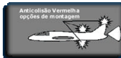
FIG. N.º 2

b) Lâmpadas halógenas (de filamento). Acendem de forma intermitente ou ficam em rotação ( beacon rotating ).